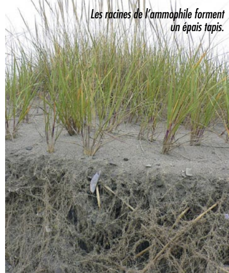
Les racines de l'ammophile forment un épais tapis.

Something new on the beaches of the Acadian Peninsula.